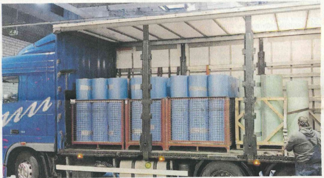
Die fertigen Böden wurden von der Spedition Purrmann zu den vereinbarten Zeiten im Lager in Horn verladen und kamen pünktlich und unversehrt an den jeweiligen Spielorten an.

Zwei Partner des TBV Lemgo Lippe waren maßgeblich an der Organisation der Handball-WM 2019 in Deutschland und Dänemark beteiligt. Sportbodenbau Möller, langjähriger Partner des TBV Lemgo Lippe in Sachen Hallenboden, ist darüber hinaus auch seit vielen Jahren Partner des Deutschen Handballbundes, wenn es um die Verlegung der mobilen Spielfelder zu Bundesliga- und Länderspielen geht. So ist es nicht verwunderlich, dass das Unternehmen vom DHB auch bei der Handball-Weltmeisterschaft 2019 mit der Spielbodenverlegung in den deutschen Spielstätten beauftragt wurde. Für den TBV-Partner war es nicht die erste WM, schon bei den Weltmeisterschaften 2007 (Männer) und 2017 (Frauen) übernahmen sie die komplette Bodenverlegung samt Transport zu den Hallen.